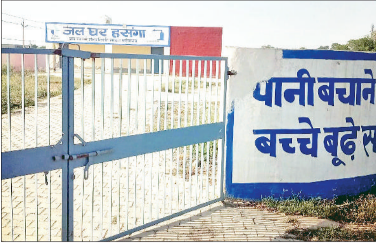
भूना। हसंगा गांव में करोड़ों की लागत से बनाया गया जल घर।