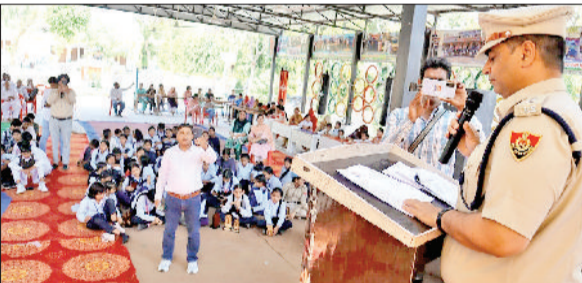
सिरसा। गांव भरोखा में विद्यार्थियों व ग्रामीणों को संबोधित करते एसपी।