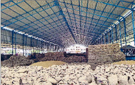
फतेहाबाद। अनाज मण्डी में पड़ी गेहूं की बोरियां।

पिछले तीन दिनों से तापमान लगातार बढ़ रहा है। मंगलवार को हालात यह थे कि अधिकतम तापमान 37 डिग्री व न्यूनतम तापमान 22 डिग्री सेल्सियस तक पहुंच गया। यानि पिछले तीन दिनों में 7 डिग्री तक तापमान बढ़ चुका है। अब गर्मी व लू के कारण गेहूं की कटाई व आवक में जोर पकड़ लिया है। मंगलवार तक फतेहाबाद जिले की 7 मंडियों और 44 खरीद केंद्रों पर 34 लाख 11 हजार 341 क्विंटल गेहूं की आवक हो चुकी है। इतनी रफ्तार से गेहूं की आवक होने से खरीद एजेंसियों के हाथ-पांव कांप रहे हैं। पहले से लिफ्टिंग के लिए तैयार न होने के कारण मंगलवार में कुल आवक में से मात्र 34718 क्विंटल गेहूं की ही