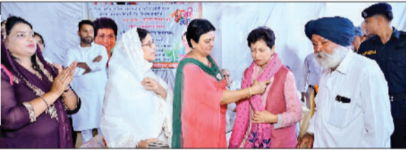
सिरसा। सांसद कुमारी सैलजा का स्वागत करते कार्यकर्ता।

अखिल भारतीय महिला कांग्रेस द्वारा आरंभ की गई देशव्यापी योजना के तहत सिरसा में भी मंगलवार को 200 महिलाओं को सैनेटरी पैड वितरित किए गए। इस दौरान सांसद कुमारी सैलजा ने कहा कि कांग्रेस महज एक राजनीतिक दल ही नहीं बल्कि एक सामाजिक दायित्व निभाने वाली संस्था भी है जो समय समय पर ऐसे आयोजन कर आमजन को लाभ प्रदान करती है।