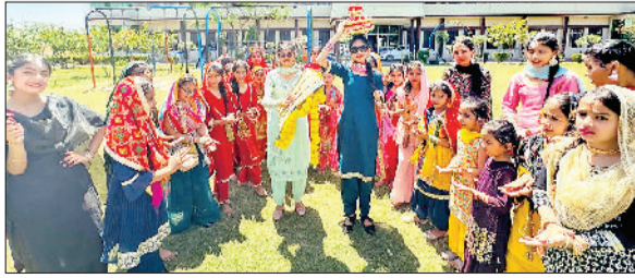
फतेहाबाद। गांधी विद्या मंदिर स्कूल में बैसाखी पर्व मनाती छात्राएं।