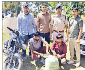
चूरापोस्त सहित पकड़ी गया आरोपी।

सीआईए ऐलनाबाद पुलिस ने गश्त व चेकिंग के दौरान बाइक सवार दो युवकों को गांव मेहनाखेड़ा क्षेत्र से हजारों रुपये का सात किलो 94 ग्राम चूरापोस्त सहित गिरफ्तार किया है। सीआईए ऐलनाबाद पुलिस टीम प्रभारी ने मंगलवार को बताया कि पुलिस टीम गश्त के दौरान गांव मेहना खेड़ा की तरफ जा रही थी। इस दौरान गांव मेहना खेड़ा के नजदीक सामने से बाइक पर प्लास्टिक थैला लेकर दो युवक आते दिखाई दिए। बाइक सवार युवकों ने सामने पुलिस की गाड़ी